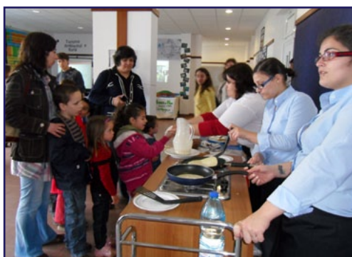
Cantinho do Francês

A par das diversas exposições permanentes com amostras dos trabalhos e projectos desenvolvidos pelos formandos dos diversos cursos, nestes dias realizaram-se workshops, seminários, almoços inglês, alemão e francês e actividades desportivas.