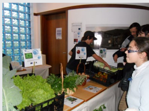
Venda de Produtos Biológicos