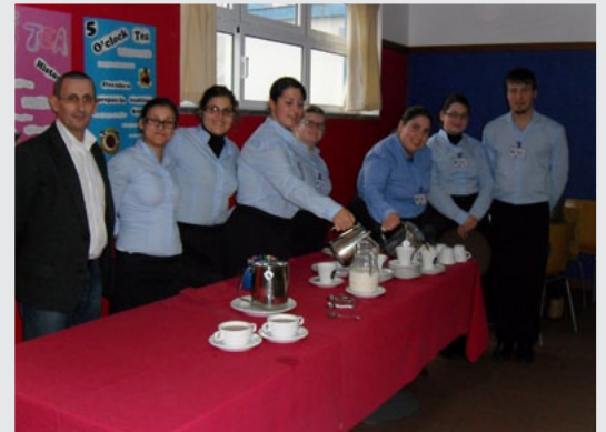
Concurso de Poesia