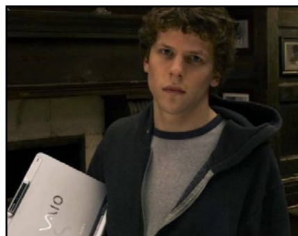
A Rede Social