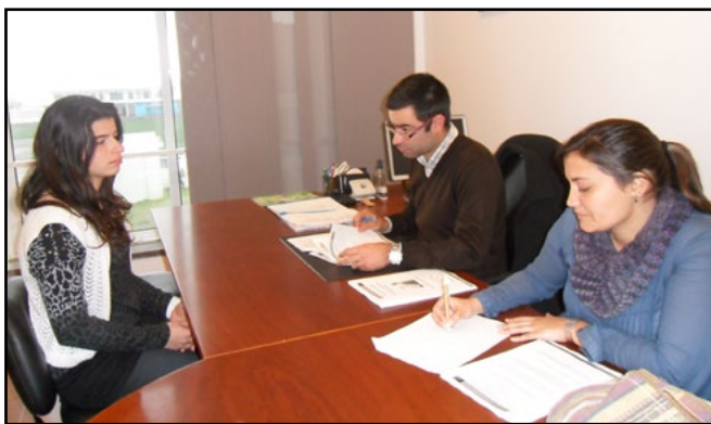
Agências de Viagens

A Escola Profissional da Ilha de S. Jorge, a par com o objectivo de formar jovens nas diferentes áreas, esforça-se também por acompanhar o percurso dos seus formandos após a conclusão do curso.