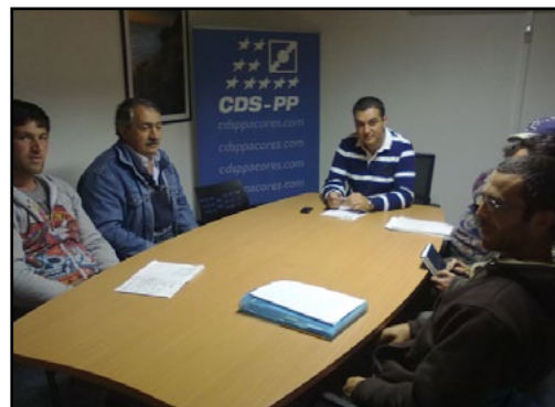
Encontro na sede do CDS-PP

O nosso sincero agradecimento ao Sr. Deputado pelo tempo dispensado e pela aprendizagem que nos proporcionou.