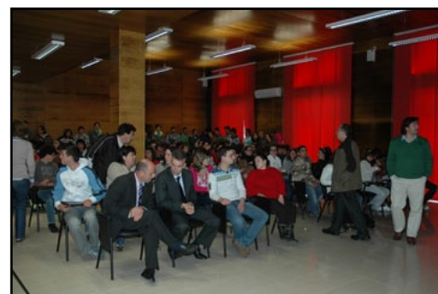
Auditório da EPISJ

Esta actividade ficou marcada pelo entusiasmo de toda a comunidade assistente.