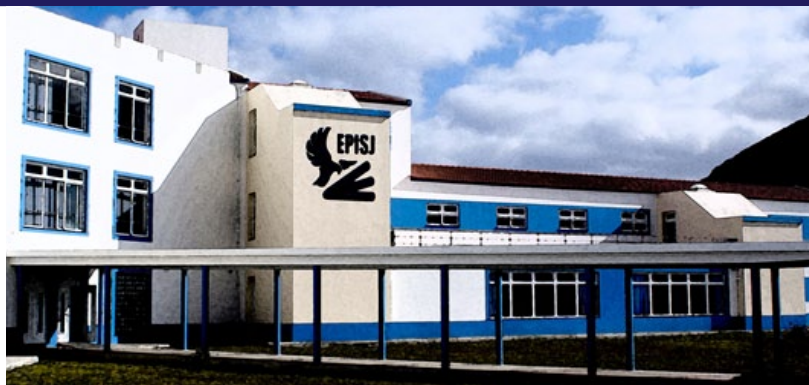
Escola Profissional da Ilha de São Jorge