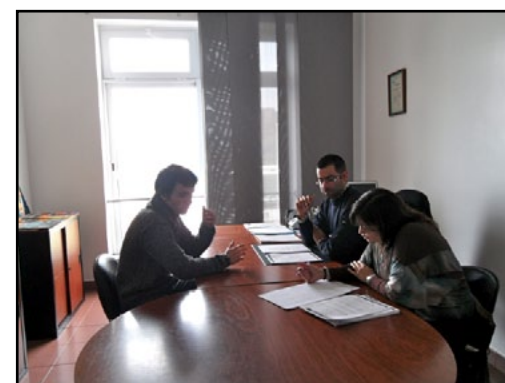
Energias Renováveis - Sistemas Solares

Para já, este trabalho está concluído com duas turmas que já se encontram em estágio. É de salientar