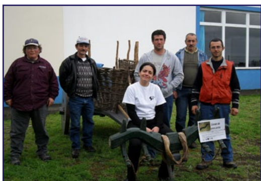
Exposição de Alfaias Agrícolas

A nossa escola promoveu uma “Semana Aberta” a toda a comunidade jorgense. Formandos e formadores empenharam-se na preparação das diversas exposições e actividades que enriqueceram os dias 5, 6 e 7 de Abril.