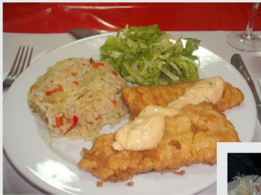
Prova de Vinhos