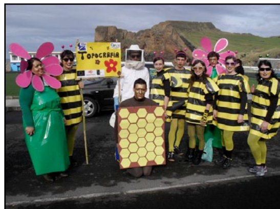
As Abelhinhas do Curso Técnico de Topografia

A Escola Profissional da Ilha de São Jorge participou mais uma vez no Desfile de Carnaval das Escolas do Concelho que decorreu na manhã do dia 3 do mês de Março. O desfile proporcionou um alegre convívio entre escolas e encheu as ruas da Vila de cor e boa disposição. Os formandos e formadores participantes estão de parabéns pelo empenho demonstrado na criação das suas fantasias. À tarde, na nossa escola, a Dupla F&F animou a sala de convívio com um baile de Carnaval.